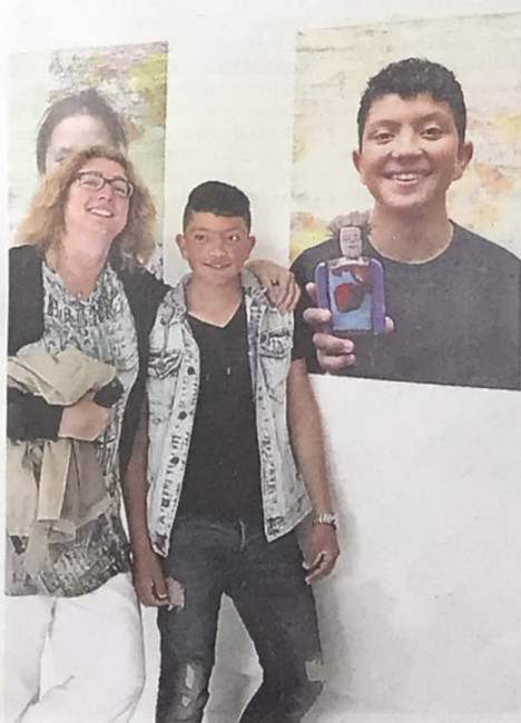
Poseren bij je eigen poster.

'Knowing me, Knowing you', 21 juni tot en met 28 augustus 2016.