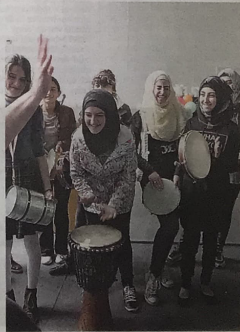
Eigen versie 'Imagine' van John Lennon.